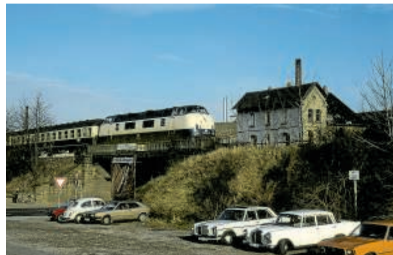
Dezember 1980 am Bahnhof Gliesmarode. Damals fuhr noch keine Straßenbahn. Der Bahnhof wird demnächst komplett umgebaut.