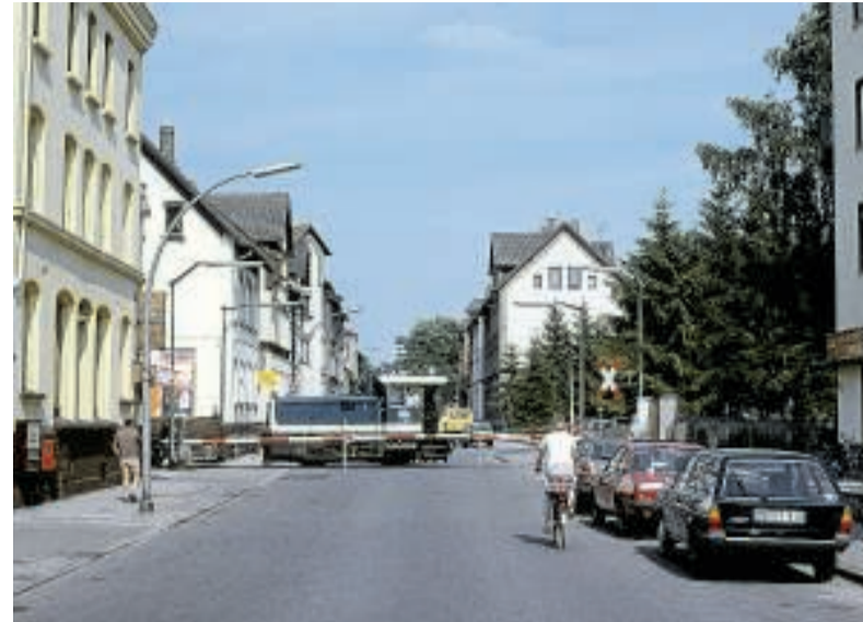
4. Juli 1982: Auf dem Ringgleis fahren noch Eisenbahnen. Das Foto entstand an der Ringgleis-Kreuzung Kreuzstraße. Die Gaststätte (links) existiert noch.

Die Stiftung erreicht man unter Telefon (0531) 390 22 62.