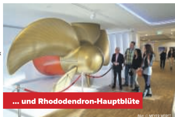
... und Rhododendron-Hauptblüte

Veranstalter: HKR GmbH 27.04. – 29.04.2018 | ab 399,- € pro Person im Doppelzimmer